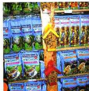
Destinée aux oiseaux en liberté, Vita Garden Special de Vitakraft répond aux besoins alimentaires de toutes les espèces sur toute l'année.

attractive. Pour un rayon animalerie, tous les produits qui rentrent dans le cadre de la protection de notre éco-système présentent l'avantage de pouvoir sensibiliser les plus jeunes d'entre nous au respect de l'environnement. Ils sont en effet attractifs, novateurs et originaux et permettent souvent d'engager un dialogue avec les jeunes clients et leurs parents. On ne répètera par exemple jamais assez que sans insectes, 90% des graines ne pourraient pas devenir des fleurs ou encore que le célèbre savant Einstein prédisait que si l'abeille disparaissait du globe, l'homme n'aurait plus que quelques années à vivre.