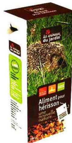
Un aliment pour hérisson signé Gruel Fayer.

Pour sensibiliser leurs clients au respect mais aussi au maintien de notre éco-système, les magasins disposent aujourd'hui d'une offre produits spécifique. Avec sa gamme Les Animaux du jardin, la société Gruel Fayer présente une offre complète d'accessoires et d'aliments permettant d'abriter, de protéger et nourrir des insectes, amphibiens, mammifères et oiseaux qui vivent tout au long de l'année dans nos jardins. Paniers et aliments pour hérisson, abri pour crapauds, coccinelles, abeilles, mangeoires et aliments pour écureuils, nichoirs et gîtes pour chauve-souris, observateurs pour insectes... la gamme est diversifiée et