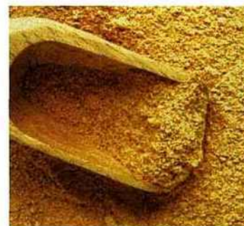
L'efficacité antibactérienne et antibiotique de la propolis a été prouvée.

L'idéal est qu'elle soit fraîche (plutôt que mélangée au miel ou en gélules de poudre lyophilisée), de la prendre à jeun, en la lais-