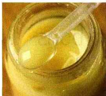
La gelée royale renforce les défenses de l'organisme.

maturité, le miel est un petit miracle de la nature ! Ses vertus ? Rapidement digéré et assimilé par l'organisme, il tonifie l'appareil digestif, régule la fonction cardiaque et augmente les capacités immunitaires.