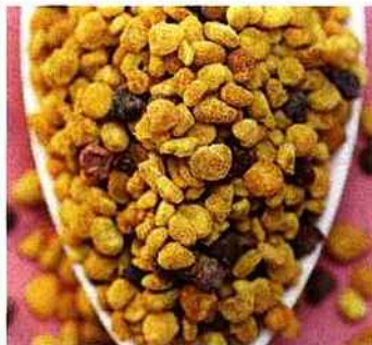
Le pollen aide à lutter contre la fatigue physique et intellectuelle.

En 1994, des chercheurs japonais ont prouvé son efficacité antibactérienne et antibiotique. Elle s'attaque à toutes les affections de la sphère ORL (angines, rhinites allergiques, sinusites chroniques, rhumes, etc.), de la sphère buccale (gingivites, aphtes et herpès labial), et surtout de la sphère dermato-